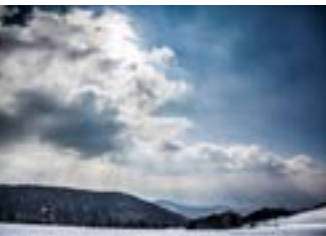
Photo et lumière d'hiver 16h - Chalet des gentianes Tarifs : 14€/pers (à partir de 10 ans) + 5€ pour les raquettes / Possibilité de repas (en sus.) Réservation obligatoire (48h à l'avance pour le repas) et renseignements : 04 73 82 61 90 / 04 73 95 47 06 / 04 73 82 26 77 • A pas de Lynx